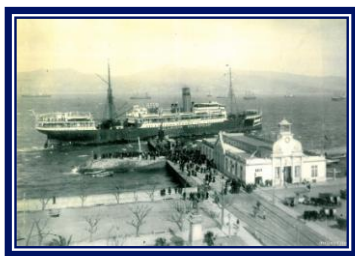
IMAGEN DE LA CUBIERTA:

El Hollandia , posteriormente Hammonia , atracando en el puerto de Vigo